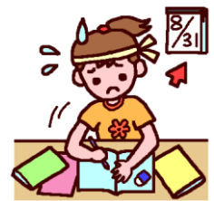
みさきのイラスト